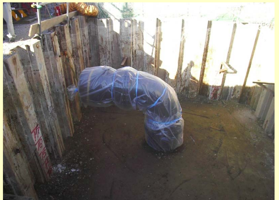
φ800mm導水管布設状況(鏡川取水所側)