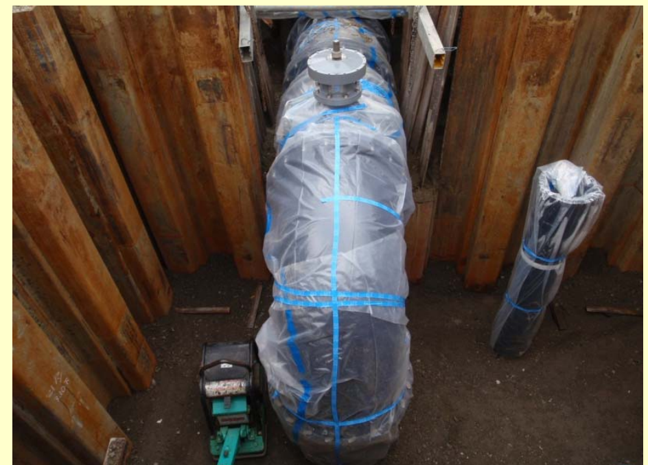
φ800mm導水管布設状況(旭浄水場側)