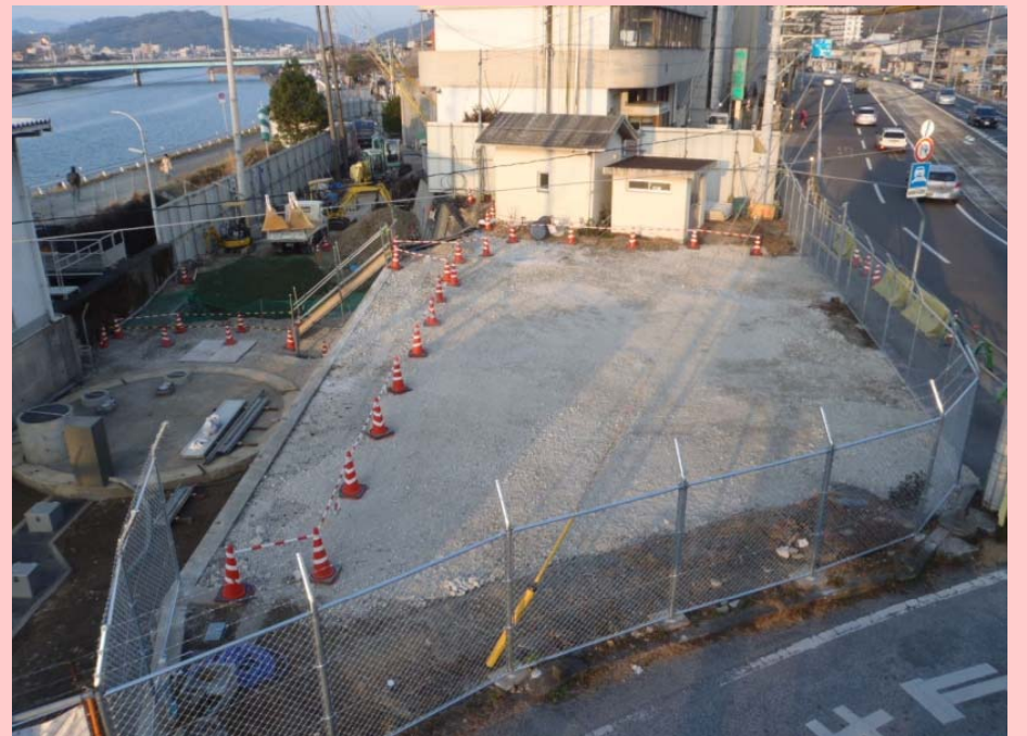
鏡川取水所側(着工前と現在の状況)