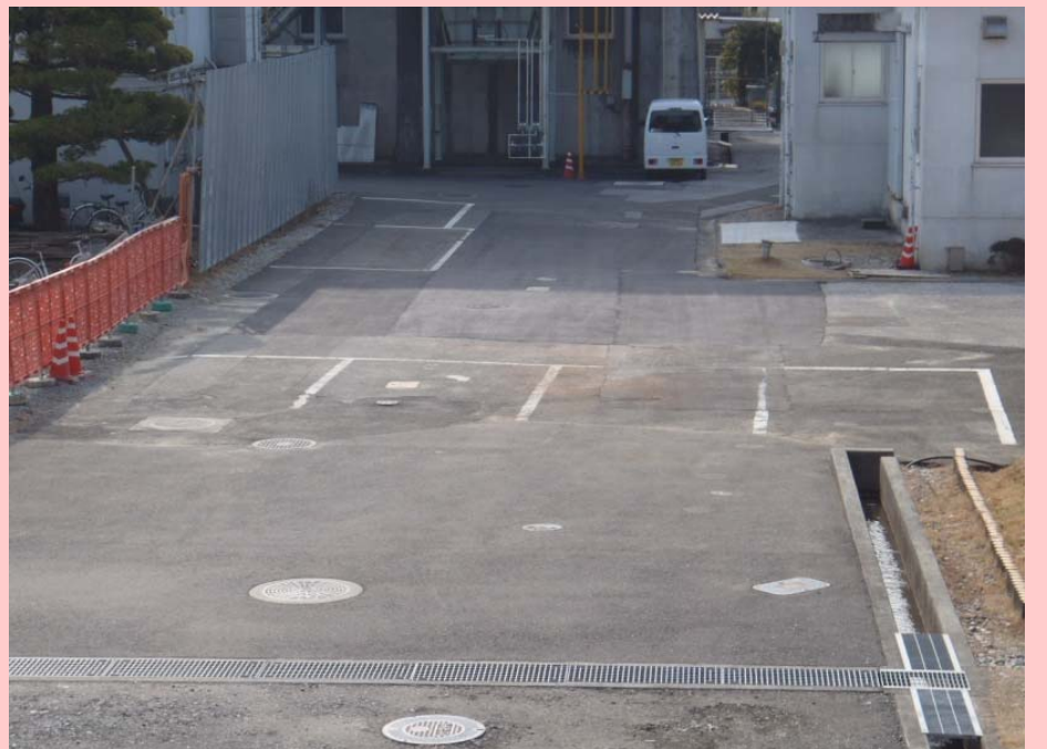
旭浄水場側(着工前と現在の状況)