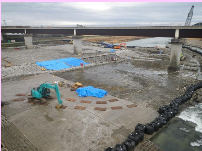
物部川橋より (西よりから撮影)