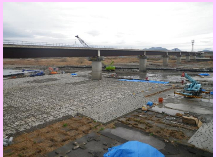
物部川橋より (東よりから撮影)