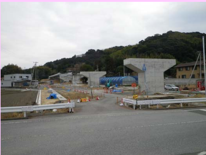
西側より (2月28日撮影)