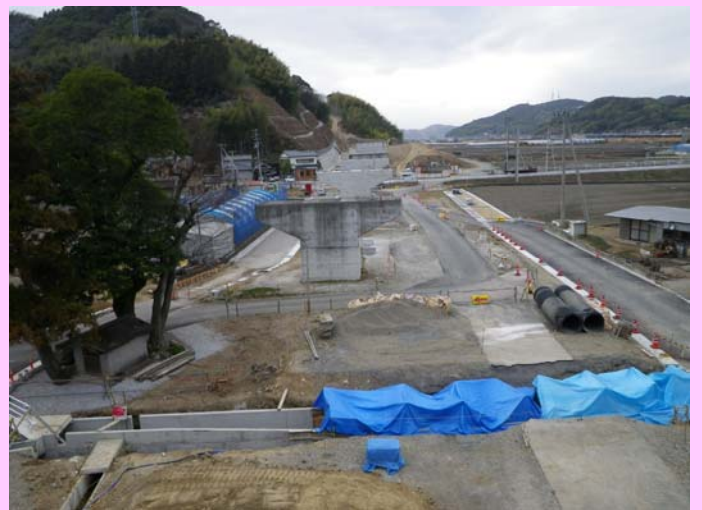
東側より (2月28日撮影)