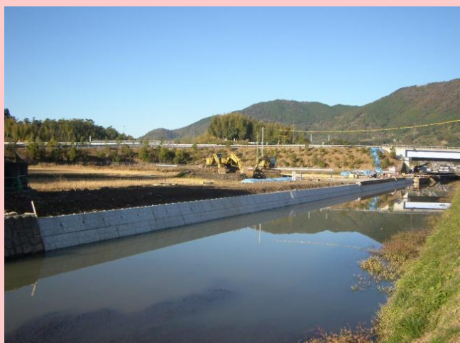
市道より撮影（12月4日撮影）

今後は、下流側より水路の設置を行いながら盛土の工事を行っていきます。引き続き工事に対するご協力よろしく申し上げます。