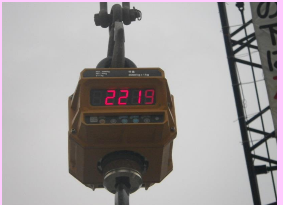
巨石の重量を確認しています(2+程度/個)