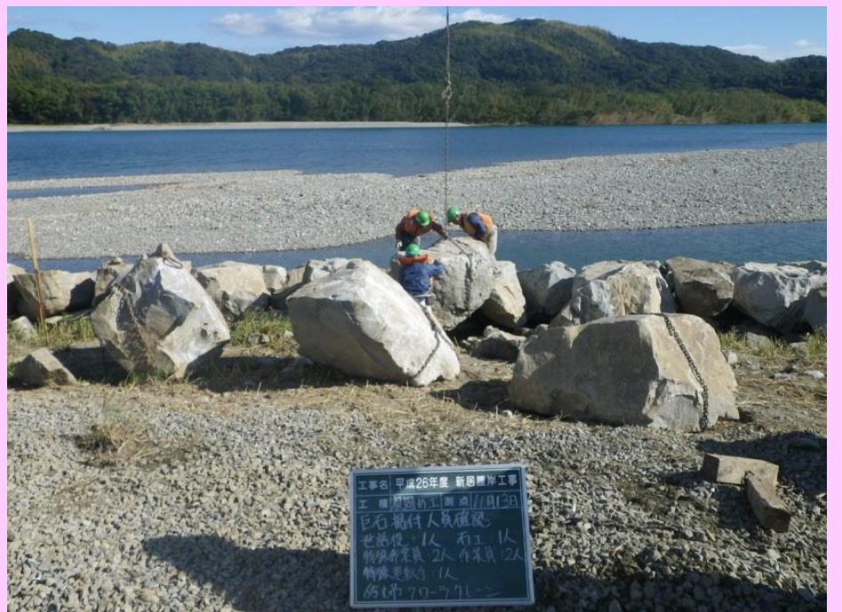
巨石据付状況(陸上部)