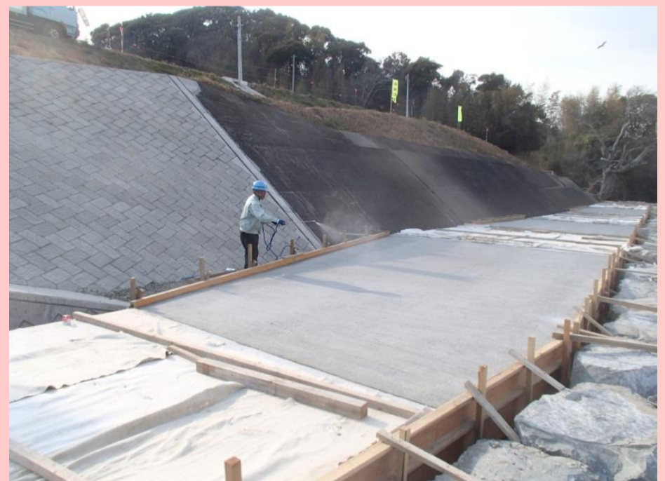
コンクリート養生状況

花粉症(かふんしょう)とはいちがたアレルギーに分類される病気の一つ。植物の花粉が、鼻や目などの粘膜に接触することによって引き起こされ、発作性反復性のくしゃみ、鼻水、鼻詰まり、目のかゆみなどの一連の症状が特徴的な症候群のことである。こそうねつとも言われる。日本においては北海道の大半を除いてスギ花粉が抗原となる場合が多い。 花粉症は、水のようなサラサラした鼻水と目のかゆみが特徴的であり、感染症である鼻風邪との鑑別点になる。鼻風邪であれば、一般的には目のかゆみはなく、数日のうちに鼻水は粘性の高いものになり、さらに黄色や緑など色のついたものとなる。