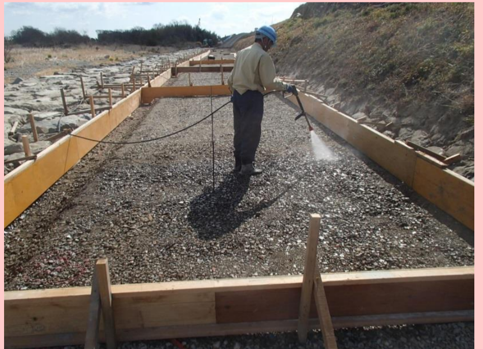
コンクリート打設箇所散水状況