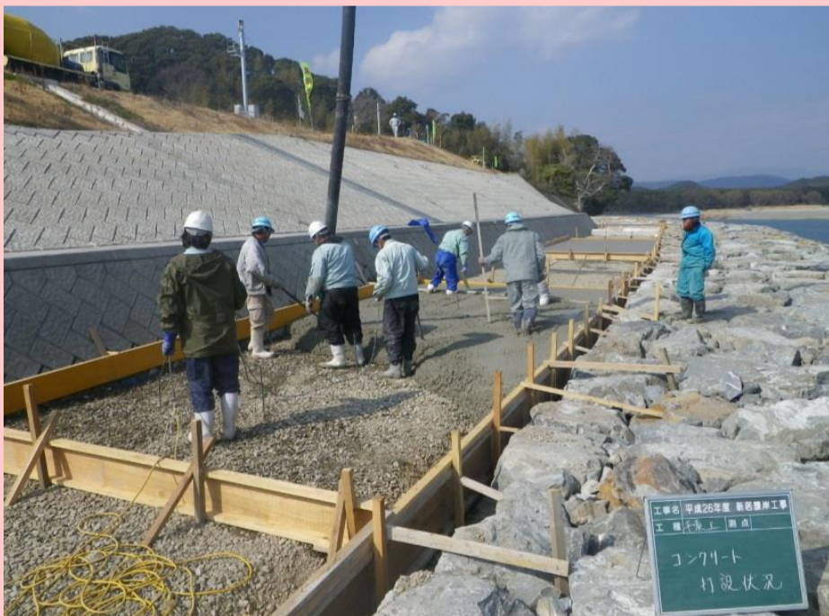
コンクリート打設状況 花粉症豆知識