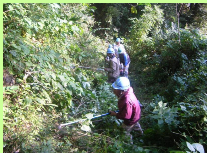
避難場所（除草状況）