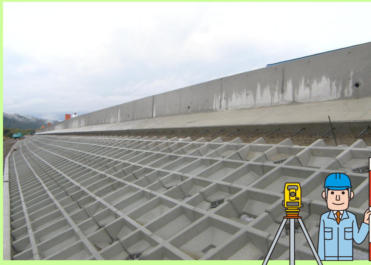
堤防を補強する為のブロックを設置しています。