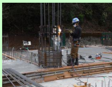
はしらきん あっせつじようきよう 柱筋の圧接状況です。

ちか の はしきん かい はしきん あっせつ あと はしきん かべきん く 地下から伸びてきている柱筋と、1階の柱筋を圧接でつないだ後、柱筋・壁筋を組み はしら かべ はり かたわく たてこ ながら柱・壁・梁の型枠を建込みます。