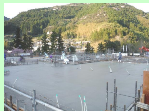
だせつ かんりよう コンクリート打設完了です。