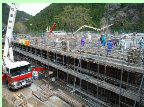
だせつ じようきよう コンクリート打設状況です。

だせつ かいゆか じゆんぼん なが いよいよコンクリート打設です。壁・柱・梁・2階床の順番でコンクリートを流していきます。 あと さかん ゆか うえ な その後、左官さんがコンクリートの床の上をきれいに慣らします。