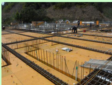
かい かたわく く 1階の型枠を組んだところ です。コンクリートを打てば かい ゆか 2階の床になります。

ご ゆか かたわく く かい はり あっせつ つづ ゆか はしきん その後、床の型枠を組んで、2階梁の圧接をして、続いて床の配筋をします。