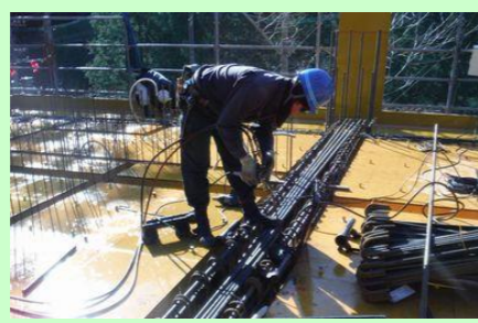
かい はり あっせつ 2階梁の圧接をしています。