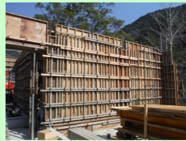
はしら かべ はり かたわく 柱・壁・梁の型枠です。

ご ゆか かたわく く かい はり あっせつ つづ ゆか はしきん その後、床の型枠を組んで、2階梁の圧接をして、続いて床の配筋をします。