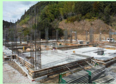
はしらきん あっせつ できあ じようたい 柱筋の圧接が出来上がった状態です。