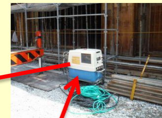
こうあつ せんじょうき 高圧洗浄機