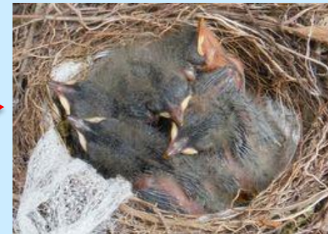
親鳥にえさを与えてもらって…