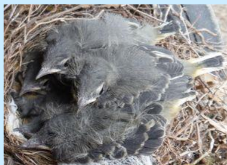
巣が狭くないすぎるぐらい どんどん大きくなったのち…