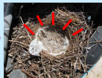
卵から孵って約2週間 後に巣立っていきま した。