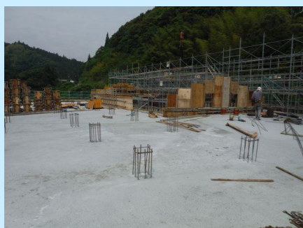
屋上・体育館：型枠・鉄筋工事

1階ではコンクリート型枠を解体した後、電気・設備やサッシなどの業者が作業をしています。また、2階でもコンクリートの強度が十分になったことを確認後、型枠の解体を行っています。このように上の階に上がりながら下から上の階までそれぞれの作業を行っています。