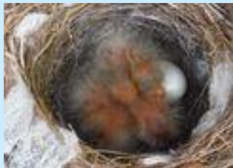
5つの卵全てが無事孵り…

人通りの頻繁なところということもあり、作業員みんなで巣を温かく見守っていましたが、無事巣立ってくれました。今後も動物たちも落ち着けるようなクリーンな環境を維持していきたいと思っております。