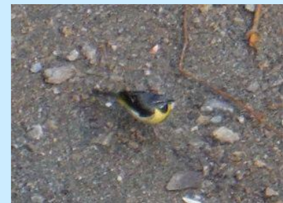
巣立ってからしばらく巣のまわりで 遊んでいましたが、親と区別がつか ないぐらいのきれいなセキレイになっ ていました。