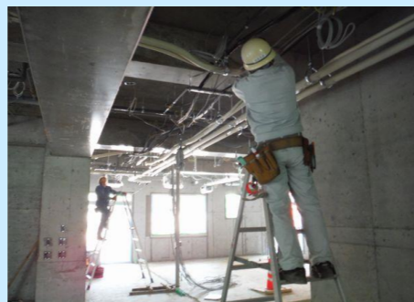
1階：電気工事・サッシ取付け他